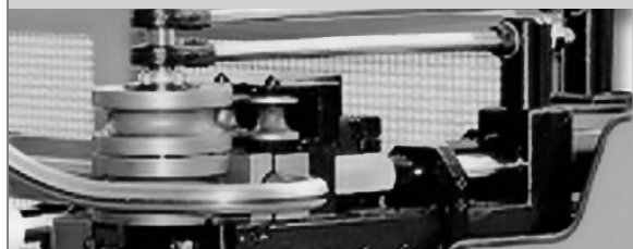
PROVAR 5 U-D