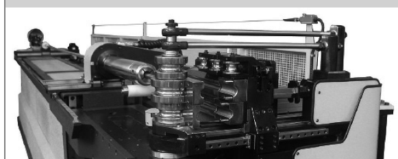
PROVAR 6 U-D