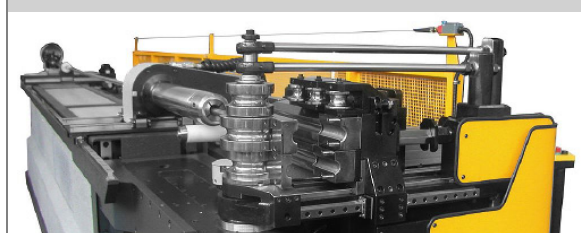
PROVAR 6 U-D